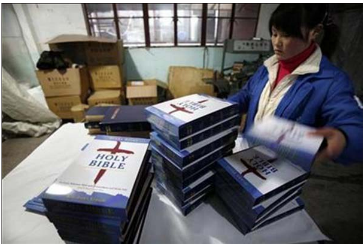
ചൈനീസ് ഭാഷയിലുള്ള ബൈബിൾ വിതരണത്തിനായി പായ്ക്കു ചെയ്യുന്നു.

ബെയ്ജിംഗ്: ക്രിസ്തുവിനെ പ്രതിജ്ഞിച്ച് മരിക്കേണ്ടിവന്നാലും ഉത്തരകൊറിയയിൽ സുവിശേഷപ്രഘോഷണം നടത്തും എന്ന തീരുമാനവുമായി ചൈനയിലെ മിഷണറിമാർ. ചൈനയിൽ സുവിശേഷപ്രഘോഷണം നടത്തിയതിന്റെ പേരിൽ നിരവധി പീഡനങ്ങൾ ഏറ്റുവാങ്ങിയ അനുഭവസമ്പത്തുള്ള സുവിശേഷപ്രവർത്തകർ ചേർന്നാണ് ഉത്തരകൊറിയയിലേക്ക് സുവിശേഷവുമായി പോകുവാൻ മിഷണറിമാർക്ക് തീരുമാനിച്ചത്. മേഖലയിലെ വിവിധ വെല്ലുവിളികളെക്കുറിച്ചും, തങ്ങളുടെ പദ്ധതിയുടെ വിവരങ്ങളെക്കുറിച്ചും പേരു വെളിപ്പെടുത്താത്ത സുവിശേഷപ്രവർത്തകർ 'ചൈന എയ്ഡ്' എന്ന സംഘടനയോട് പങ്കുവെച്ചു.