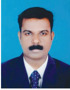
തയ്യാറാക്കിയത്: ജോൺ ജേക്കബ്, പുനലൂർ

പ്രൈം ടൈം തൊഴിഞ്ഞ ഇടവേളയിൽ അവരോട് ആൽമരണത്തിൽ ഒത്തുകൂടി. പതിവിൽ കവിഞ്ഞ് സുന്ദരീ. സുന്ദരന്മാരായി കാണപ്പെട്ട അവരെല്ലാം വളരെ ആഹ്ലാദത്തിലായിരുന്നു. അല്ലെങ്കിലും സഭാരാധനയെക്കൊണ്ടും ഉപവാസപ്രാർത്ഥനയെക്കൊണ്ടും അവരേറെ ഇഷ്ടപ്പെടുന്നത് യുത്ത് മീറ്റിംഗുകൾ തന്നെയാണല്ലോ. പിൻവാങ്ങാൻ മടിച്ചു നിന്ന കാര്യമേലാണു തീർത്ത കവചത്തിൽ ആൽമരവും അതിന്റെ പരിസരവും അല്പം ഇരുണ്ട് പോയെങ്കിലും അവസരോചിതമായി കുഞ്ഞുദീപങ്ങൾ തെളിയിച്ച് മിന്നാമിന്നി കൂട്ടങ്ങൾ ആ സദസ്സിന് വെളിച്ചമേകി. പ്രാർത്ഥനയോടെ മീറ്റിംഗ് ആരംഭിച്ചു സങ്കീർത്തനം വായന പ്രാർത്ഥനയിൽ തുടങ്ങി ഉപകരണം, റിപ്പോർട്ടുവായന തുടങ്ങിയ സ്ഥിരം ഔപചാരിക കസർത്തുകളെല്ലാം നടക്കുമ്പോഴും വിശ്വാസികളിലധികവും നടത്തേണ്ടുന്ന പ്രോഗ്രാമുകൾ കൃത്യവും ഹൃദ്യവുമായതിനുള്ള അവസാനവട്ട ഒരുക്കങ്ങളിലായിരുന്നു. വ്യക്തിഗത പ്രോഗ്രാമുകളിൽ അദ്വൈതത്വം ആസ്ഥാന ഗായികയായ പുളളി കൃഷ്ണയുടെ ഒരു പാട്ടായിരുന്നു. ശ്രുതിശുദ്ധതയുള്ള സമ്മേളനത്തിന്റെ ആകെ തുകയായ ആകീർത്തനത്തിലൂടെ അവൾ സദസ്യരെ കയ്യിലെടുത്തു. നല്ലൊരു പുല്ലാങ്കുഴൽ നാദം പോലെ ആത്മാവിനെ തൊട്ടുണർത്തിയ അവളുടെ പാട്ടിനെ എല്ലാവരും മുക്തമനസ്സോടെ പ്രശംസിച്ചു. അടുത്തത് മയിലിന്റെ ഊഴം മനോഹരമായ ഒരു ആക്ഷൻ സോംഗ് ബഹുവർണ്ണപ്പീലികൾ വിടർത്തി പാട്ടിന്റെ താളത്തിനൊത്ത് ചുവ