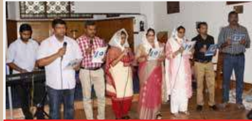
St. Thomas Evangelical Church