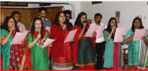
Manama Brethren Assembly