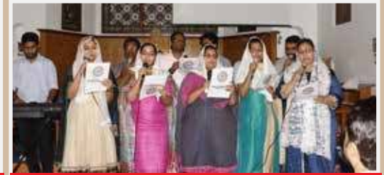
Sharon Fellowship Church