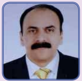
ഓഡിറ്റർ ബ്രദർ കോർ മാത്യു (അസംബ്ലിസ് ഓഫ് ഗോഡ് ചർച്ച്)