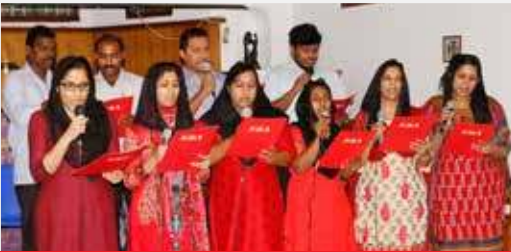
Ebenezer Brethren Assembly