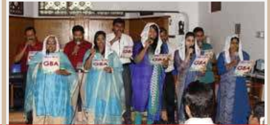
Gafool Brethren Assembly